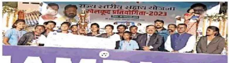
विरसा मुंडा फुटबाल स्टेडियम में मुख्यमंत्री खेलकूद प्रतियोगिता की विजेता टीम ● जागरण

ये रहे फाइनल परिणाम : हाकी बालिका वर्ग में गुमला की टीम विजयी रही। इन्होंने उपविजेता सिमडेगा को 4-1 से शिकस्त दी। वहीं हाकी बालक वर्ग में पश्चिमी सिंहभूम की टीम विजेता रही। उपविजेता गुमला की टीम को 2-1 से मात दी। वालीबाल बालक वर्ग में पश्चिमी सिंहभूम की टीम विजेता रही जबकि खूंटी की टीम उपविजेता। वालीबाल बालिका वर्ग में पश्चिमी सिंहभूम विजेता