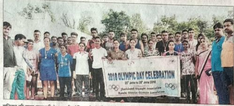
शनिवार की सुबह राजधानी के एपेसी स्टेडियम में ओलंपिक डे के अवसर पर रन का आयोजन किया गया।

सुबह शुरुआत की श्रद्धांजलि: शाम का बजे बने नए सुबह की शुरुआत श्रद्धांजलि के प्रतिभागी संगीत के बिरसा