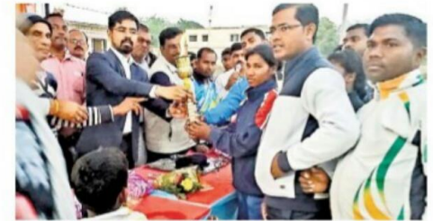
खिलाड़ियों को मशाल सौंपते डीडीसी