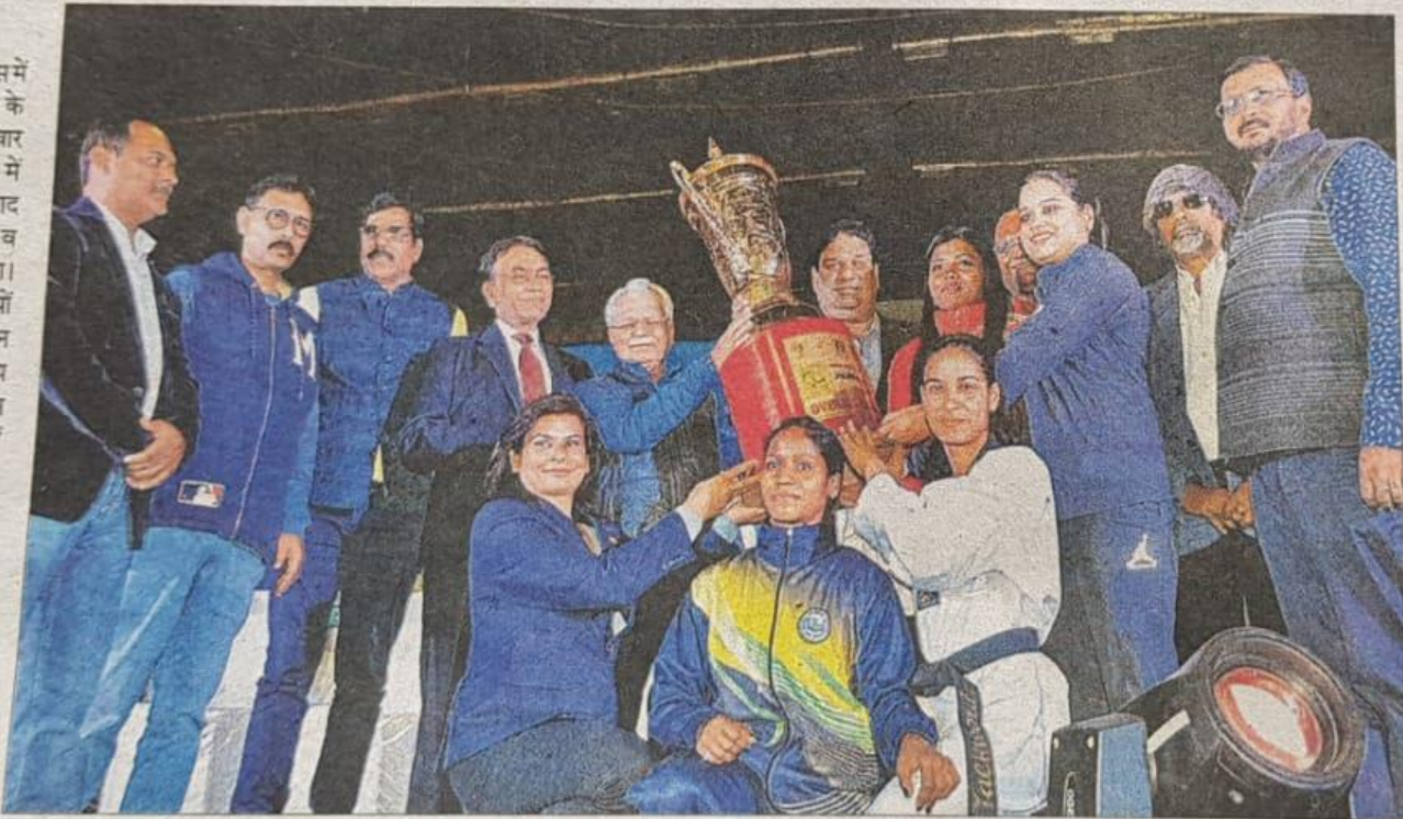
राज्य खेल के समापन पर मंगलवार को होटवार में आयोजित कार्यक्रम में आयोजन समिति के पदाधिकारियों व अतिथियों ने चैंपियन टीम रांची को ट्रॉफी प्रदान की।

रांची को 50 स्वर्ण पदक : रांची के खिलाड़ियों ने स्टेट गेम्स में पहले ही दिन से पदक तालिका में बढ़त बनाए रखी और ओवरऑल विजेता बनने का गौरव हासिल किया। दूसरे स्थान पर बोकारो रहा। पूर्वी सिंहभूम तीसरे स्थान पर रहा। रांची के खिलाड़ियों ने शानदार प्रदर्शन करते हुए 50 स्वर्ण, 34 रजत तथा 30 कांस्य पदक पर कब्जा जमाया। बोकारो को नौ स्वर्ण, छह रजत तथा पांच कांस्य पदक मिले। सिंहभूम को सात स्वर्ण, आठ रजत तथा 10 कांस्य पदक प्राप्त हुए।