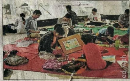
रांची प्रेस क्लब में गुरुवार को आयोजित पेंटिंग प्रतियोगिता में भाग लेते बच्चे।