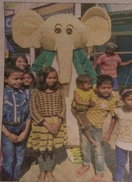
रविवार को रांची में झारखंड स्टेट गेम्स के मस्कट को शहर में घुमाया गया।