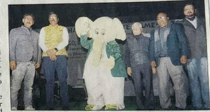
LOVABLE: Mascot Buchu with JOA officials in Hotwar, Ranchi, on Friday.

various parts of the city to make people aware about the upcoming sporting event," Anand said.