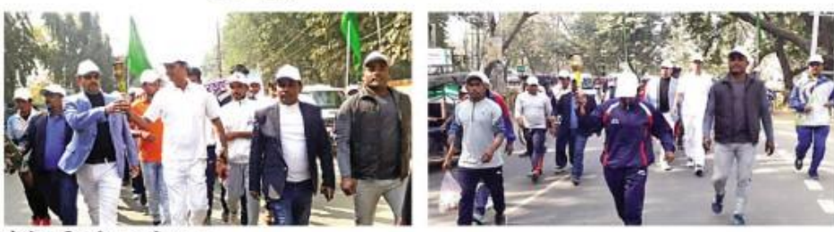
दौड़ते पदाधिकारी व स्कूली छात्राएं।