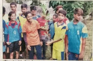
शनिवार को रांची में ओलंपिक डे रन का आयोजन किया गया।

रांची। ओलंपिक दिवस के अवसर ओलंपिक डे रन का आयोजन किया गया। शनिवार को एपेसी स्टेडियम में हॉकी मैच शुरू होने से पहले खिलाड़ी को प्रेरणा देने के लिए प्रदर्शन में मुख्य वर्ग में झारखंड ए 2 प्रखंड 1 को 1-0 से हराया। महिला वर्ग में झारखंड ए 2 प्रखंड 1 को 4-1 से हराकर कबड्डी हुई।