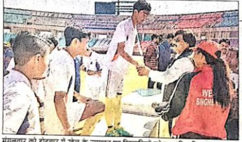
मंगलवार को होटवार में खेल के समापन पर खिलाड़ियों को सम्मानित किया गया।