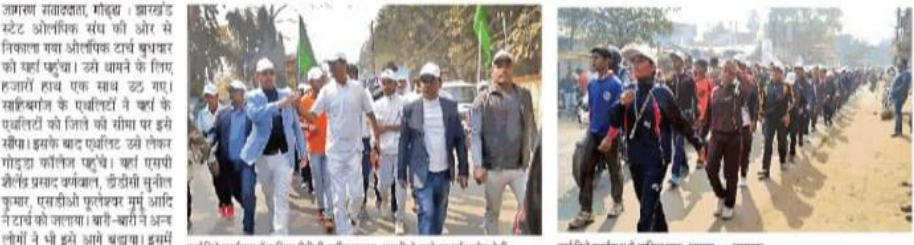
टार्च रिले कार्यक्रम में शामिल छात्रों की तुलना कर, एकदिवसीय क्विज प्रतियोगिता में शामिल छात्र-छात्राएं

पांच हजार से अधिक छात्र-छात्राओं ने लिया भाग, गोड्डा कॉलेज मैदान से शुरू होकर रौतारा तक गया