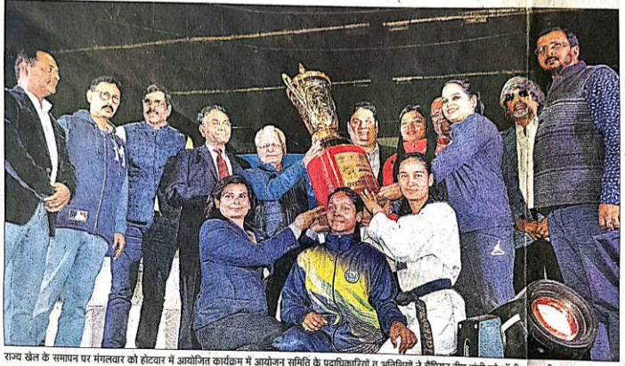
राज्य खेल के समापन पर मंगलवार को होटवार में आयोजित कार्यक्रम में आयोजन समिती के पराधिकारियों व अतिथियों ने दीपियन टीम रांची को ट्रॉफी प्रदान की।